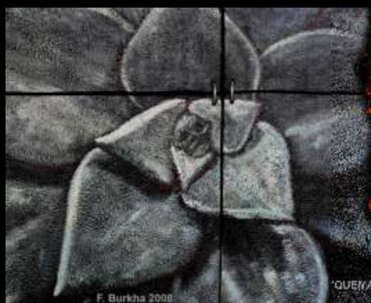
QUEMAS (détail) acrylique et cendres volcanique sur bois, acier, terre, 2008