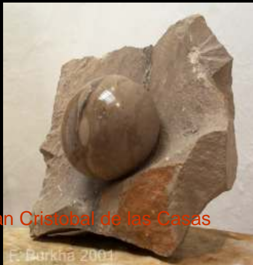
San Cristobal de las Casas