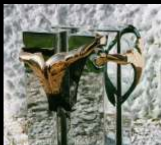
VIDE bronze et aluminium, 1993