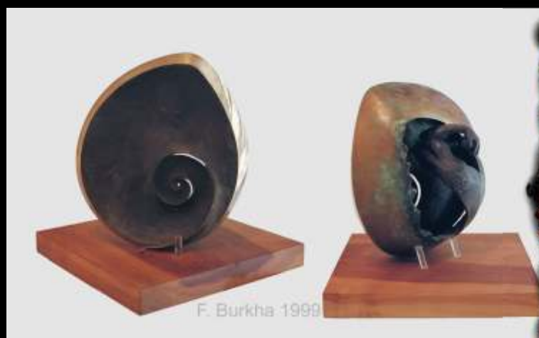
13 PORTES bronze, 1999