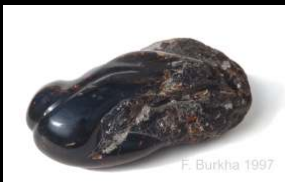
DOS ambre noir, 1997