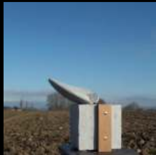
TEMPLE pierre calcaire, poirier, ambre, 2000

Dès 1997, à San Cristobal de las Casas - MX, j'ai repris mon travail d'architecte. Ce qui m'a permis de libérer mon activité de sculpteur de toutes contraintes financière