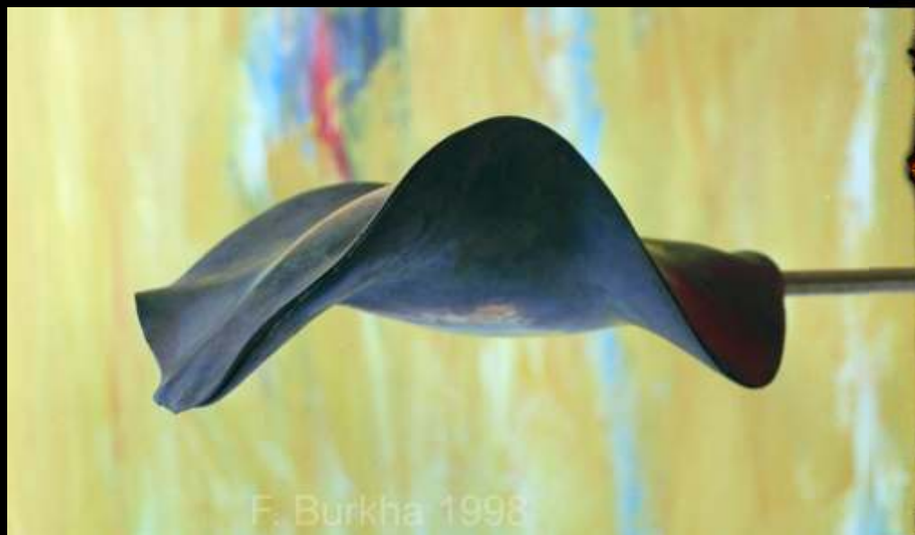
JACA bronze, 1998