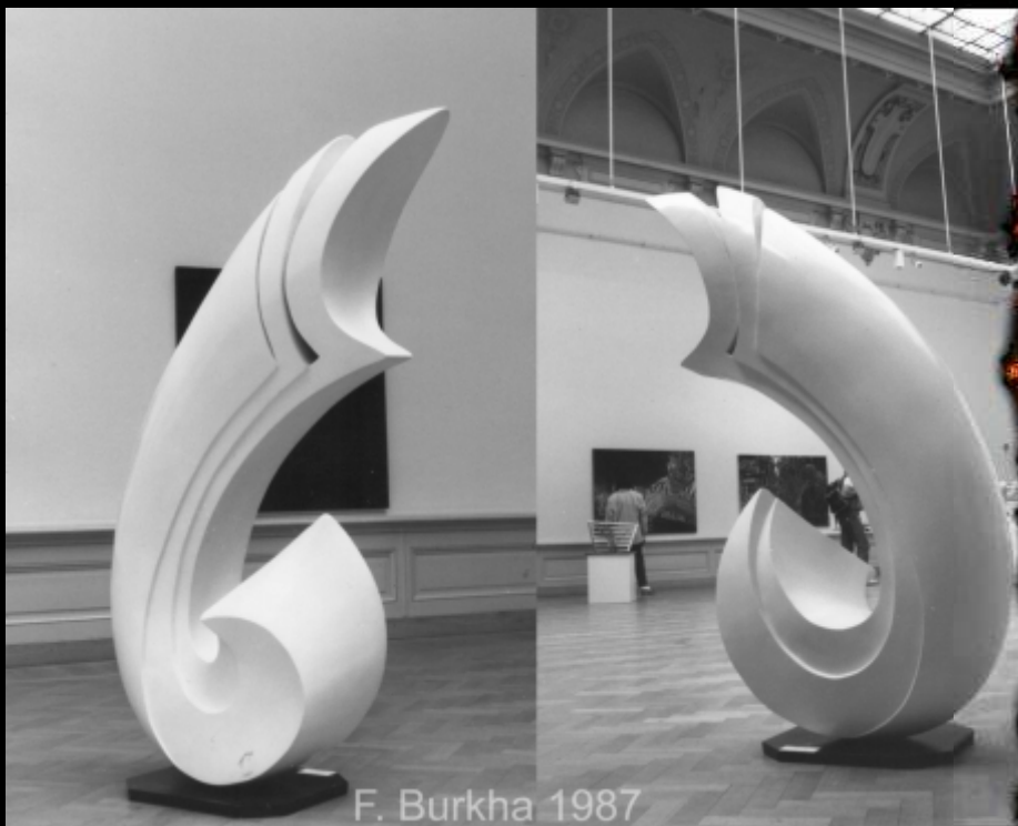
F. Burkha 1987

Exposition "Jeunes Artistes" Musée cantonal des Beau-Arts, Palais de Rumine, Lausanne. 1987