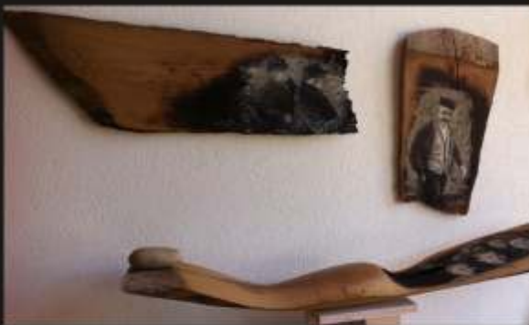
F. Burkha 2013 INSTALLATION IDENTITÉ

L'application de pigments, cendre terre, par couches successives apporte la lumière et révèle l'objet peint (illusion) qui commence à dialoguer avec l'objet sculpté (réel)