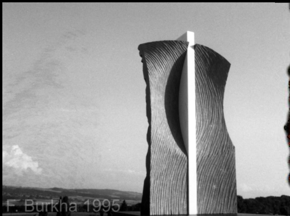
F. Burkha 1995

Depuis cette rencontre le feu est devenu un élément symbolique important de mon travail artistique: moyen technique et iconographique: destruction ou point de départ.